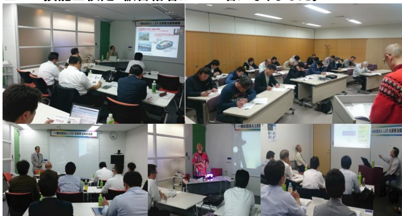
写真①:LED技能士検定授業風景