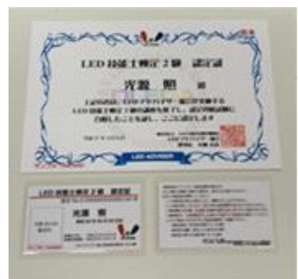
【写真②LED技能士検定認定書/認定パス】